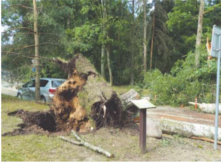
Lajų tako ir Puntuko akmenų prieigose suniokota dešimtis medžių.

Liepos 13-ąją, antradienį, pavakare kilusi audra vien Anykščių mieste išvertė ir su šaknimis išrovė dešimtis medžių. Žiauriai nuniokotas Anykščių šilelis Lajų tako ir Puntuko akmenų prieigose, kur kelių arų plote išlaužyti arba su šaknimis išversti stori beržai, pušys, drebulės. Per audrą prie Lajų tako medžiai užvirto ant lengvojo automobilio, jame buvę žmonės nenukentėjo, tačiau iš automobilio be ugniagesių gelbėtojų pagalbos išlipti jiems nepavyko.