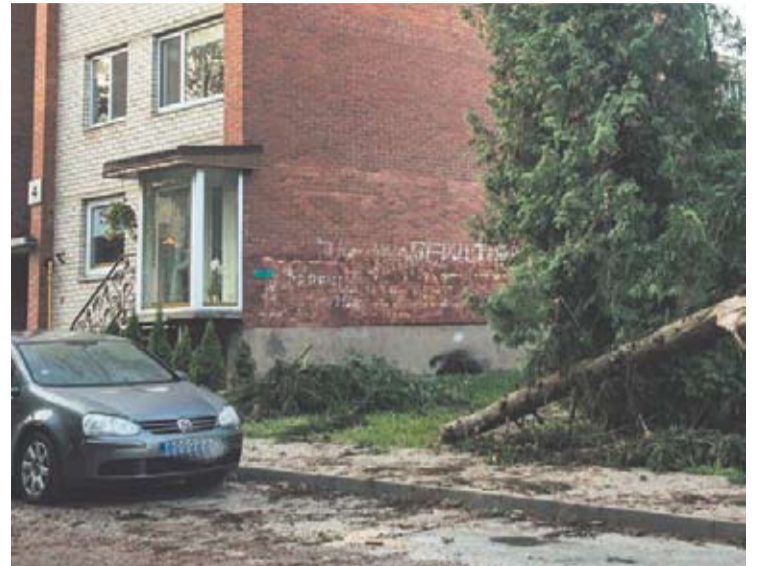
Ramybės mikrorajone škvalas nuskynė eglę.

O didelė dalis Anykščių rajono antradienį ne tik audros išvengė, bet ir lietaus negavo.