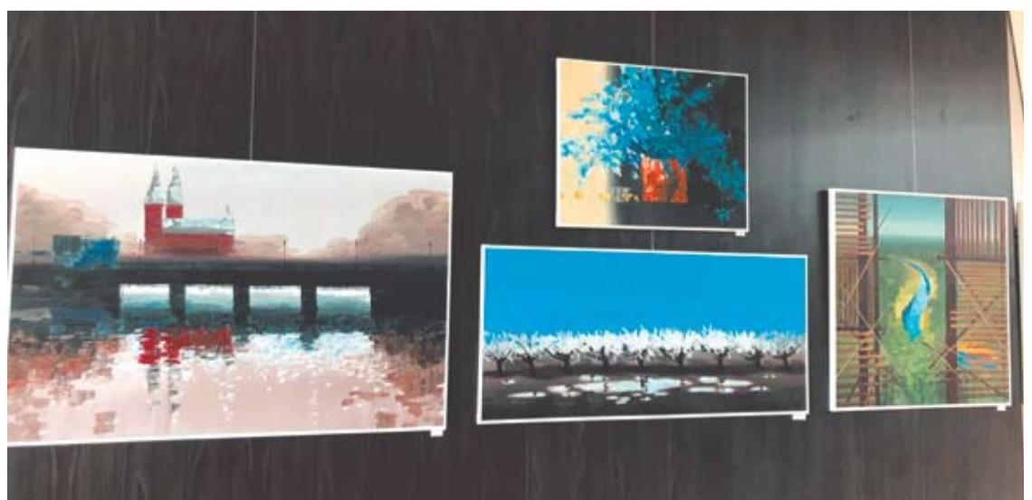
19 pieštų paveikslų eksponuojama Anykščių kultūros centro fojė.