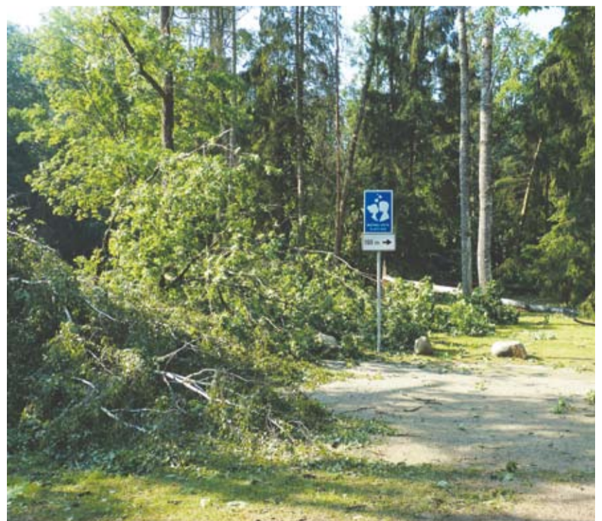
Vėjo bučinių vieta...