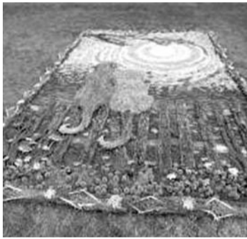
Kasmet kilimų pynėjai stebina savo išradingumu.

Anykščių rajono savivaldybė liepos 23-25 dienomis kviečia apsilankyti tarptautiniame floristinių kilimų konkurse „Vasaros atogrąžas Anykščiuose“, kuris miesto gyventojus džiugins jau 13-tą kartą.