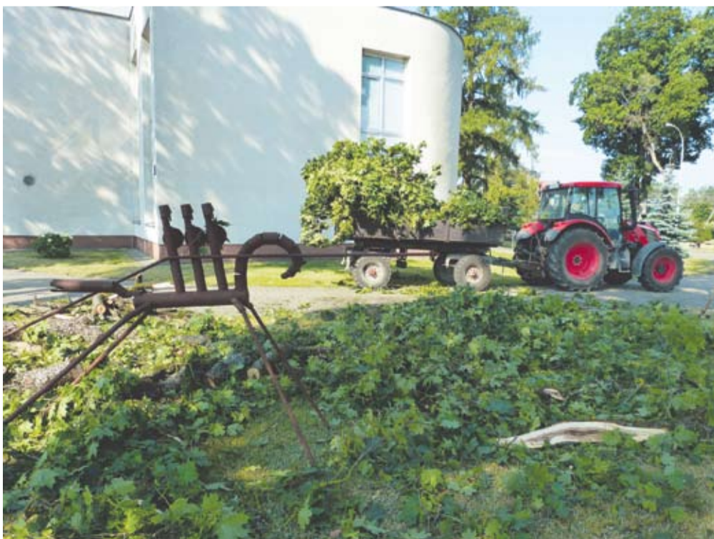
Prie Anykščių koplyčios antradienį dirbo komunalininkai.

bėda, jog prisipirkau apie 300 vienetų augalų vazonuose. Sodinu naktimis ir nešu iš kūdros vandenį. Rankos jau gerokai pailgėjo“, - ironizavo meras. Jis patarė dekoratyvinių augalų dažnai nelaistyti, geriau rečiau, bet gausiai ir vėlavakare. „Puodelio vandens užpylimas ant augalo gali tik pabloginti situaciją“, - aiškino tūkstančių augalų daržą prižiūrintis rajono vadovas.