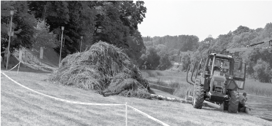
Samdyta įmonė išgrėbia ir žoles iš upės.