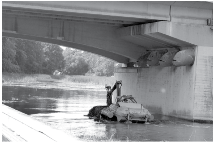
Už vieną Šventosios atkarpos nušienavimą savivaldybė mokės per 4 tūkst. eurų.

Daugelį metų Šventosios upės vaga buvo šienaujama dalgiais. Reguluojant užtvankos šliuzus, kuriam laikui būdavo sumaži-